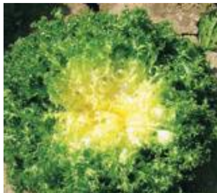
Aery (Isi Sementi).