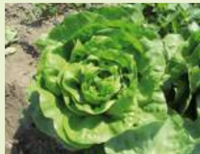
MS01 LX1303 (Meridiem Seeds).