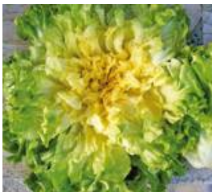
OR Lindaplusk (Four).