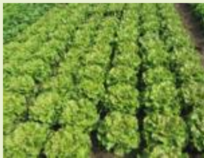
MS01 LX1000 (Meridiem Seeds).