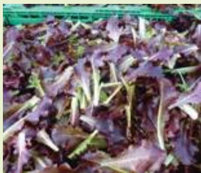
T&T Excellent (T&T).

Elevata omogeneità, eccellente colore rosso intenso, uniformità di crescita, buon sapore, alta resistenza alle lavorazioni meccaniche: sono i punti di forza di T&T Excellent , altra gentilina da baby leaf. La densità di semina consigliata è di circa 2 g/m 2 (semina meccanizzata). L'epoca indicativa di semina è al Nord da metà febbraio a fine ottobre, al Centro-Sud l'intero anno. ■ G.F.S.