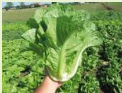
MS01 LR801 (Meridiem Seeds).

MS01 LR801 è una romana bionda per produzioni di pieno campo, indicata per cicli di fine primavera, piena estate e inizio autunno. La pianta ha portamento eretto a base allargata, con foglie di grosso spessore. Ottima è la tenuta alla salita a seme, al tip burn e alla spiralizzazione. HR: BI 1-24, 27-28, 30-31; IR: Fol 1. ■ G.F.S.