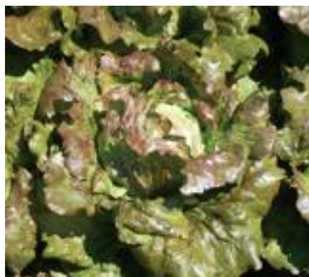
OR Rosplus (Four).

Gautier propone due novità per serra. Kerilis è una batavia da serra per autunno e primavera, verde brillante, con cespo aperto e compatto. La foglia è riccia, bollosa ed elastica, con buona tenuta alle manipolazioni. Il fondo è semiconico, pieno, con poco scarto e taglio piccolo. La pianta è dotata di buon peso