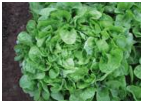
Kiber RZ (Rijk Zwaan).

RZ è una iceberg di prossima introduzione commerciale, per il pieno campo invernale, vigorosa, voluminosa e pesante, senza chiudere eccessivamente, con foglia spessa e carnosa. HR: BI 1-26, 28, 31/Pb.