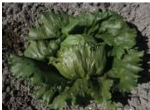
Nun 00145 (Nunhems).