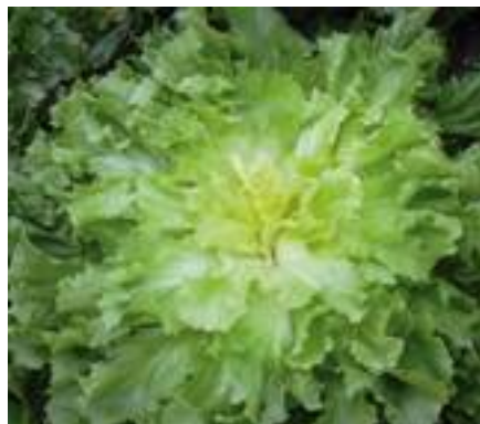
Dafne (Isi Sementi).