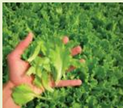
T&T Elisa (T&T).

lungo la costa. Avral RZ è un'endivia riccia estivo-autunnale anch'essa di prossima introduzione commercia-