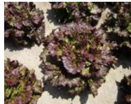
Nun 05350 (Nunhems).

Due sono anche le gentiline. Othilie RZ è una gentilina primaverile e autunnale da serra e pieno campo molto flessibile nell'uso, con pianta compatta e pesante, brillante e facilmente lavorabile. HR: BI 1-