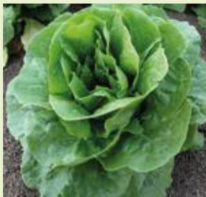
Osiride (Enza Zaden).