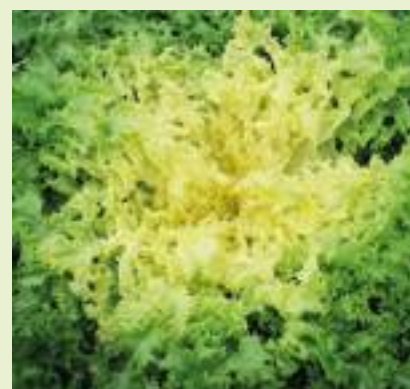
Domari (Enza Zaden).

foglie di colore verde medio brillante. Ottima è la presentazione del fondo ben serrato e con colletto molto piccolo. Il cuore internamente è denso e giallo. La conformazione contenuta del cespo permette un maggior investimento di piante per superficie. HR: BI 1-31. Tre sono pure le romane da pieno campo. Aragona è una romana bionda a ciclo medio, indicata per cicli primaverili tardivi ed estivi. Il cespo è compatto, con un alto numero di foglie e buon peso, ha un comportamento eretto, a sviluppo semiaperto, non serrato alla sommità. La foglia è di colore biondo brillante, leggermente bollosa. Il fondo è