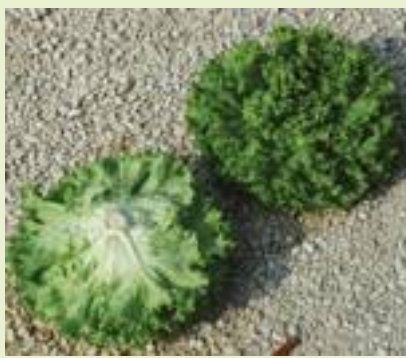
TT 131 (T&T).