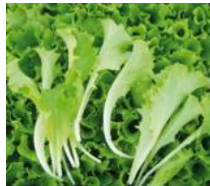
Dorian (Isi Sementi).

lante. Mostra buona tolleranza agli sbalzi termici, notevole elasticità di raccolta in campo ed è idonea anche per la IV gamma. HR: BI 1-27, 29/Nr 0. Le lattughe da taglio comprendono diverse batavie.