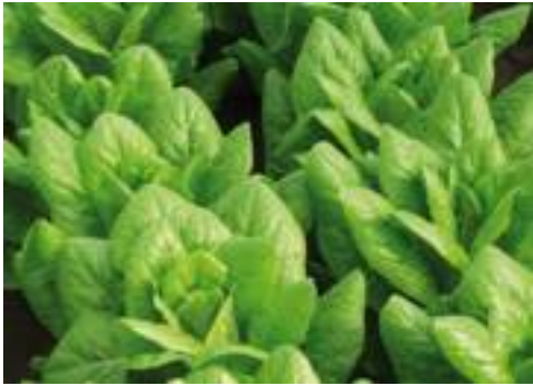
41-127 RZ (Rijk Zwaan).

crispy (a foglia frastagliata) verde estremamente produttiva ed affidabile. HR: BI 1-31/Nr 0; IR: LMV 1.