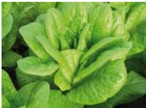
Domitius RZ (Rijk Zwaan).

RZ è una iceberg di prossima introduzione commerciale, per il pieno campo invernale, vigorosa, voluminosa e pesante, senza chiudere eccessivamente, con foglia spessa e carnosa. HR: BI 1-26, 28, 31/Pb.