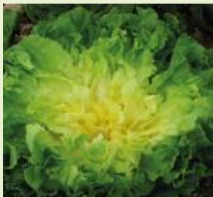
Performance (Enza Zaden).

Domari (E 02.7162) è un'indivia riccia molto precoce, indicata per raccolte primaverili e autunnali precoci (nel Fucino è ottima per le raccolte di fine giugno e tutto luglio). La pianta è eretta e di buone dimensioni, riempie precocemente il cuore di un bel colore giallo intenso. È molto tollerante alle necrosi marginali e alla salita a seme in primavera e molto resistente al fenomeno della radice cava. ■ G.F.S.